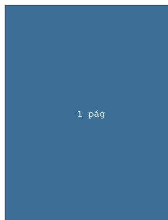
23 x 30cm + 4 mm de excedente por lado. 23,8 x 30,8 cm FINAL